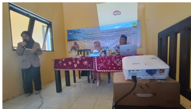
Gambar 3. Proses Pemberian Materi oleh Pemateri 2

Hasil observasi menarik kesimpulan bahwa terdapat perbedaan dalam pemahaman setiap anggota kegiatan. Perbedaan dapat ditemui pada kemampuan anggota kegiatan tentang model pembelajaran terutama model mind mapping. Hasil dari pelaksanaan kegiatan sosialisasi teridentifikasi yakni sasaran pelaksanaan sosialisasi penggunaan model mind mapping untuk muatan pembelajaran IPS mampu meningkatkan pemahaman anggota peserta sosialisasi dengan rata-rata terkategori baik telah tercapai. Oleh karena itu diharapkan setelah berakhirnya kegiatan sosialisasi ini pendidik dapat mengimplementasikannya dalam kegiatan pembelajaran di sekolahnya masing-masing.