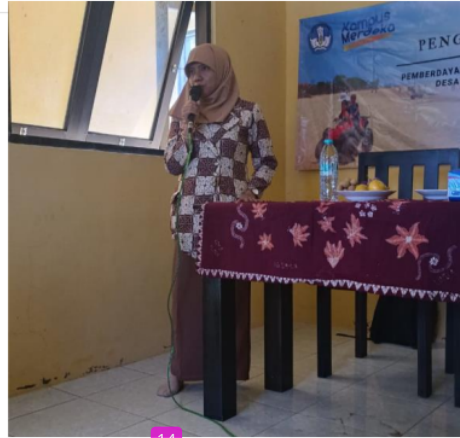
Gambar 3. Proses Pemberian Materi oleh Pemateri 1