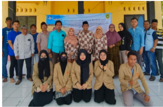
Gambar 2. Foto Bersama Peserta Sosialisasi

Hasil pengabdian menunjukkan bahwa para anggota peserta sosialisasi, yaitu kepala sekolah serta para pendidik UPTD SDN Gili Anyar sangat bersemangat dalam kegiatan sosialisasi tersebut. Terbukti dari jumlah partisipasi anggota sosialisasi, total jumlah partisipan anggota sosialisasi yang ikut tingkat persentase kehadirannya 90% atau hanya dua anggota peserta sosialisasi yang tidak dapat hadir dikarenakan ada kepentingan mendadak. Para anggota peserta sosialisasi menaruh perhatian yang sangat tinggi terhadap kegiatan sosialisasi ini karena hasil dari kegiatan sosialisasi penggunaan model pembelajaran mind mapping dapat memberikan kejelasan dalam penggunaannya serta bagaimana langkah-langkah yang benar dalam penerapannya pada muatan pembelajaran ilmu pengetahuan sosial, hal ini sangat dibutuhkan bagi setiap pendidik untuk menjadi pengetahuan baru dalam hal penggunaan model pembelajaran salah satunya model mind mapping. Hal ini juga membantu lembaga pendidikan dalam meningkatkan pengetahuan pendidik di sekolah dasar. Berikut ditampilkan foto bersama antara peserta dengan pemateri sosialisasi