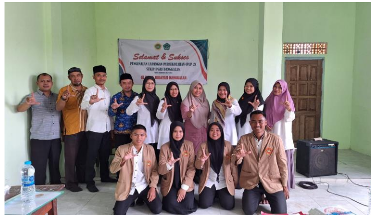
Gambar. Pembukaan PLP II