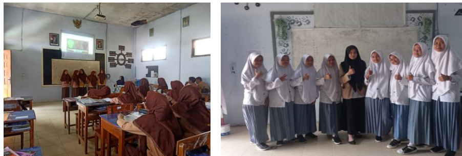
Gambar. Kegiatan Mengajar