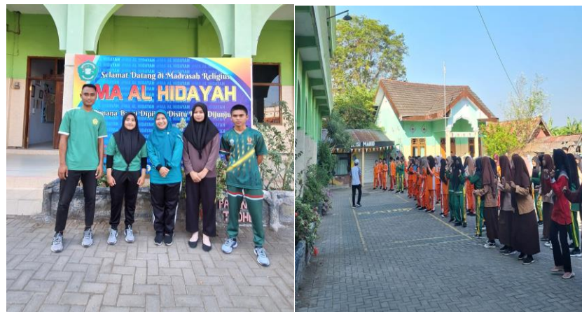
Gambar. Kegiatan Senam Bersama