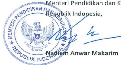
Nadiem Anwar Makarim

Menteri Pendidikan dan Kebudayaan Republik Indonesia,