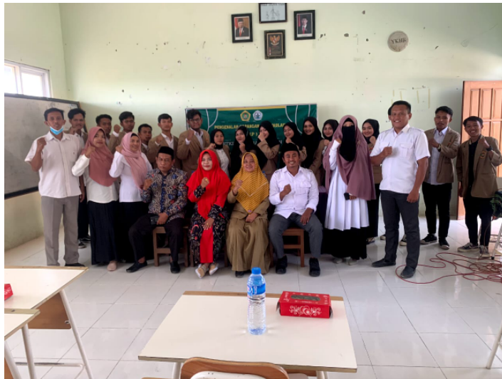
FOTO KEGIATAN PLP II PEMBUKAAN PLP II DI SMAS ISLAM YKHS SEPULU