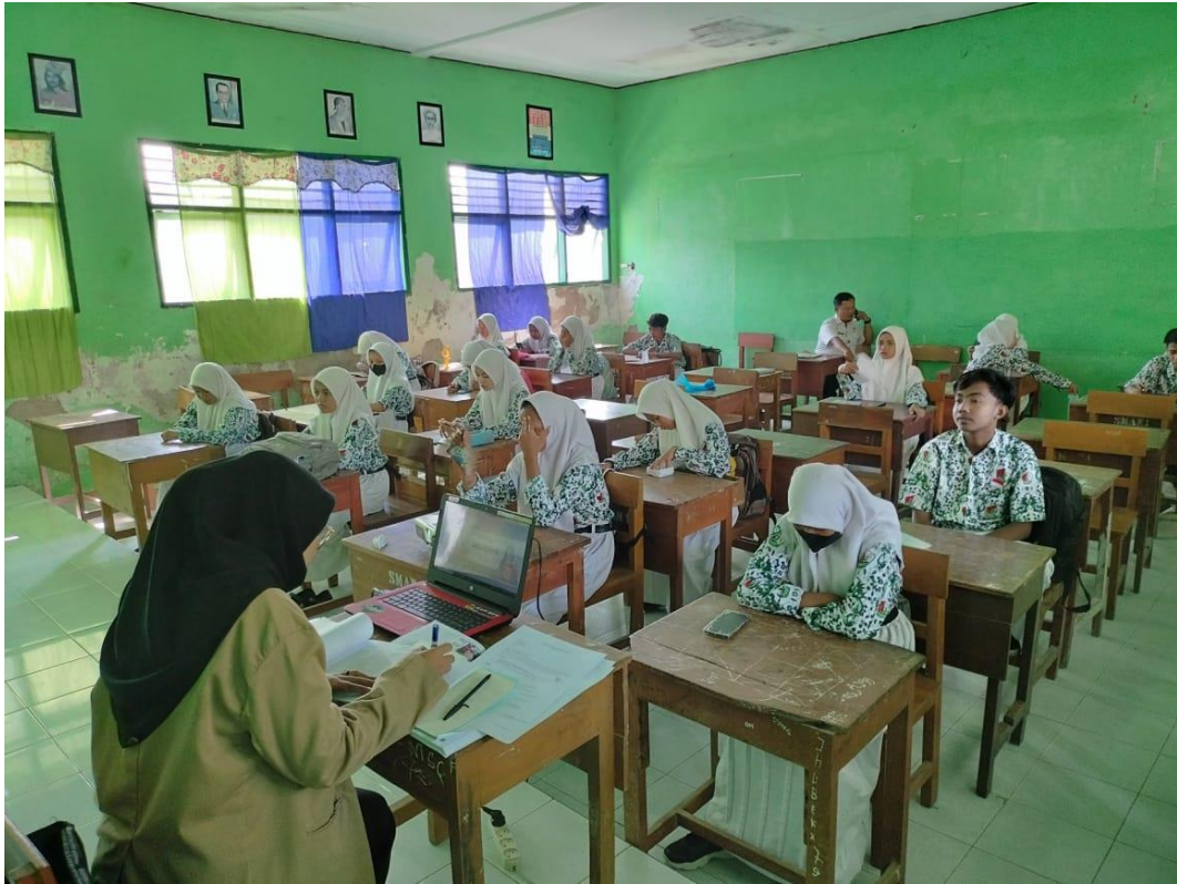
Lampiran Bersama Siswa Kelas X 1 SMA Negeri 1 Sresih