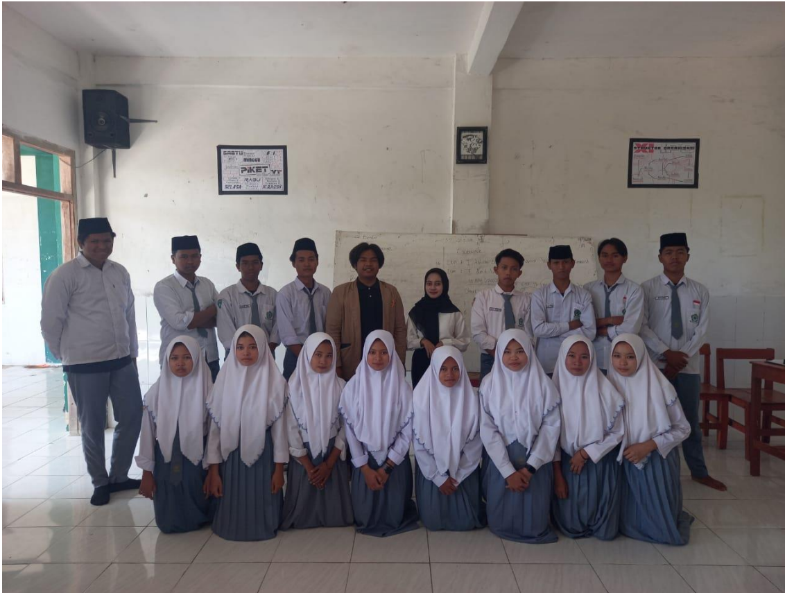
Lampiran 9 Kegiatan Mengajar di Kelas