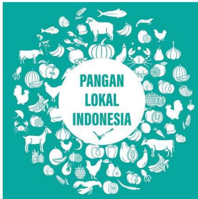
Gambar 1.5 Poster Pangan Lokal Indonesia 1