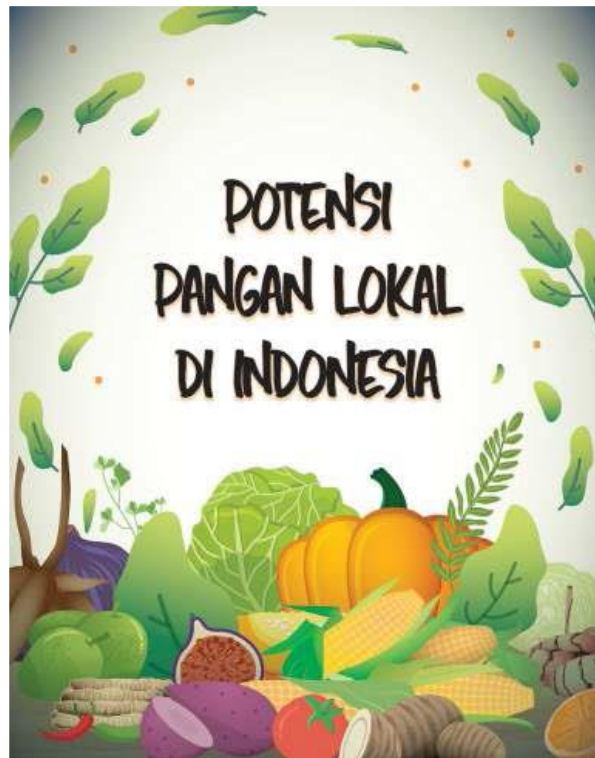
Gambar 1.6 Poster Pangan Lokal Indonesia 2