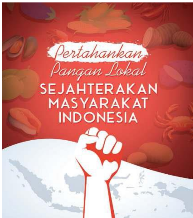
Gambar 1.4 Poster dengan Tema Potensi Pangan Lokal Indonesia

Perhatikan poster berikut dan identifikasilah apa yang dimaksud dengan poster dan apa tujuan pembuatan poster.