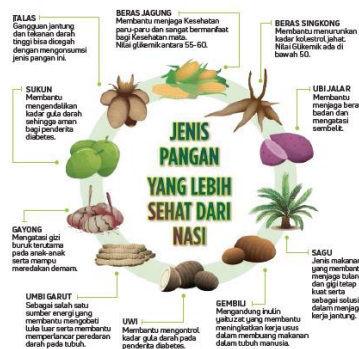
Gambar 1.1 Jenis-Jenis Makanan Pokok di Indonesia