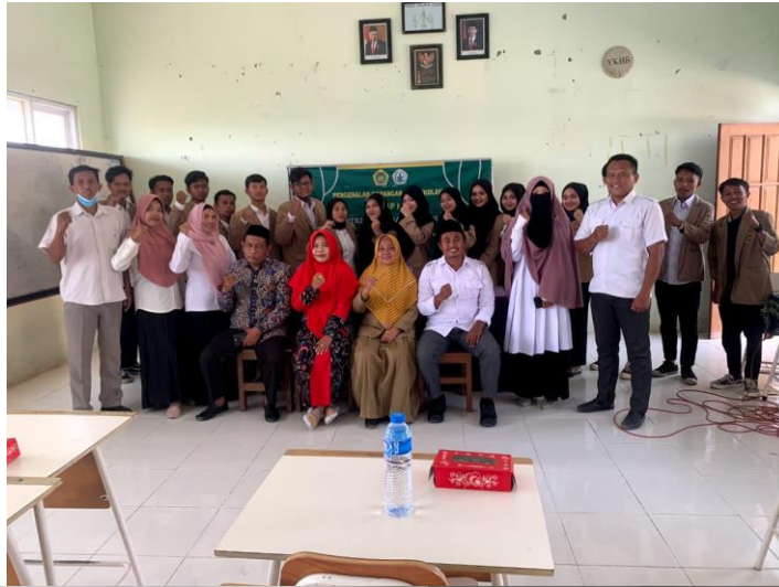
FOTO KEGIATAN PLP II PEMBUKAAN PLP II DI SMAS ISLAM YKHS SEPULU