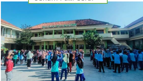
Senam Pagi Cerai