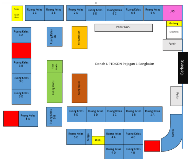
Gambar 1.1 Gambar Denah UPTD SDN Pejagan 1 Bangkalan

UPTD SDN PEJAGAN 1 Bangkalan adalah sebuah institusi Pendidikan sekolah dasar negeri yang berlokasi di Jl. Bhayangkara Moh.hosen No.5-a, PEJAGAN, Kec. Bangkalan, Kab. Bangkalan Prov. Jawa Timur. Sekolah Dasar Negeri Pejagan 1 Bangkalan tidak terlalu jauh dari jalan raya, sehingga mudah dijangkau oleh alat transportasi. Suasana sekolah cukup kondusif, mengingat sekolah ini berada dalam lingkungan tempat tinggal penduduk. Fasilitas sekolah dan ruang yang dibutuhkan sudah memenuhi, sekolah yang terjaga dan indah. Lingkungan sekolah sudah bersih, sering kali terkotori dengan sampah dedaunan, mengingat banyaknya tumbuhan seperti pohon yang cukup membuat asri lingkungan sekolah. Jumlah ruangan untuk pembelajaran dan ruangan pendukung terbilang lengkap, seperti ruang kelas, ruang pertemuan, ruang UKS, ruang perpustakaan, kantin, mushola, dan lain-lain. Lihat tabel di bawah untuk keterangan yang lebih lengkap.