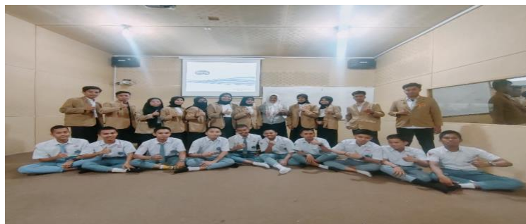
Gambar.2.1. Kegiatan Microteaching

Selain membuat Rencana Pelaksanaan Pembelajaran (RPP), mahasiswa praktikan juga membuat media pembelajaran sebagai usaha untuk mempermudah proses belajar mengajar di kelas. Media yang dibuat disesuaikan dengan materi yang akan disampaikan. Metode pembelajaran yang dipergunakan dalam kegiatan belajar mengajar tidak hanya metode ceramah tetapi juga ada variasi dari beberapa metode lainnya. Tujuannya supaya siswa lebih mudah dalam memahami pembelajaran dan proses belajar mengajar menjadi tidak monoton atau membosankan