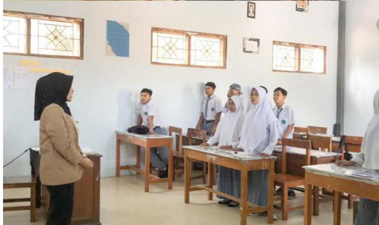
Gambar Kegiatan Pembelajaran di Kelas