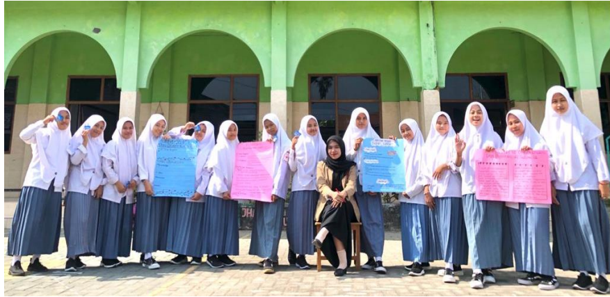
Gambar Hasil Kerja Kelompok Siswa XI IPS