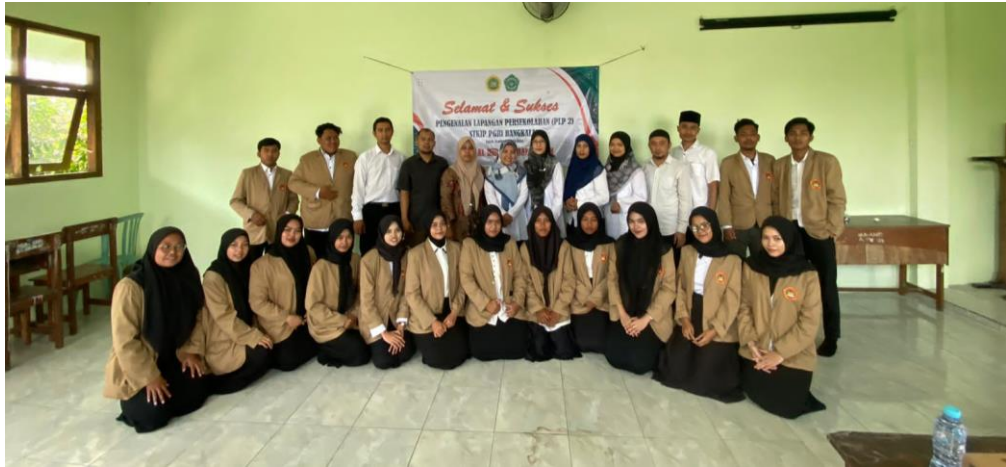
Gambar Pembukaan PLP 2