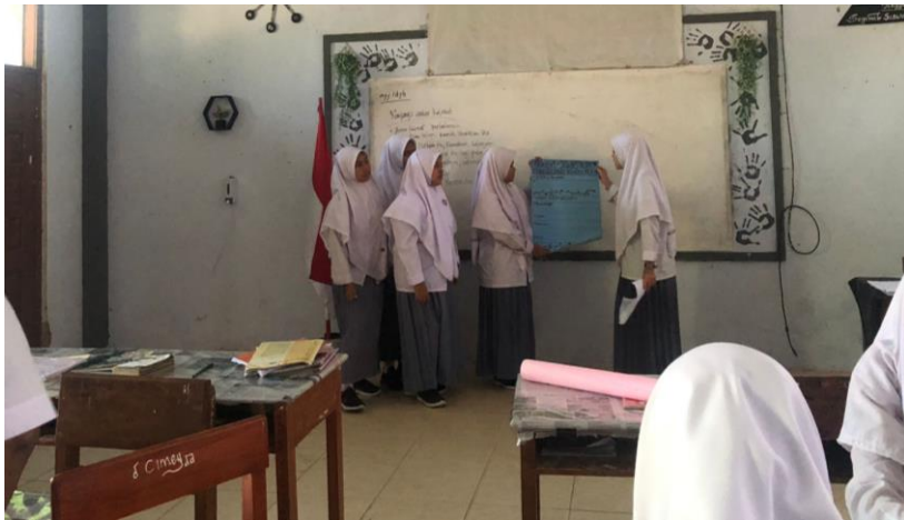
Gambar Presentasi Siswa-Siswi Kelas XI IPS