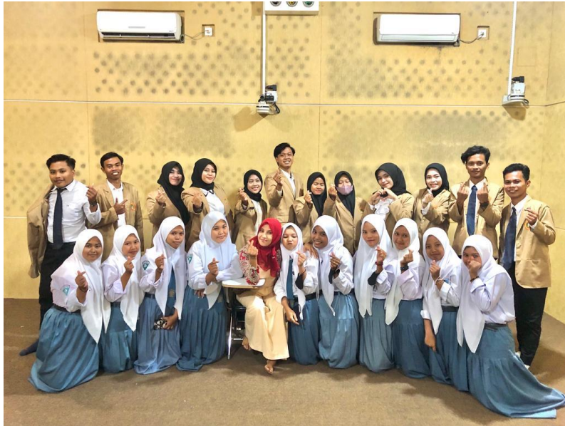
Gambar 2.1 Microteaching