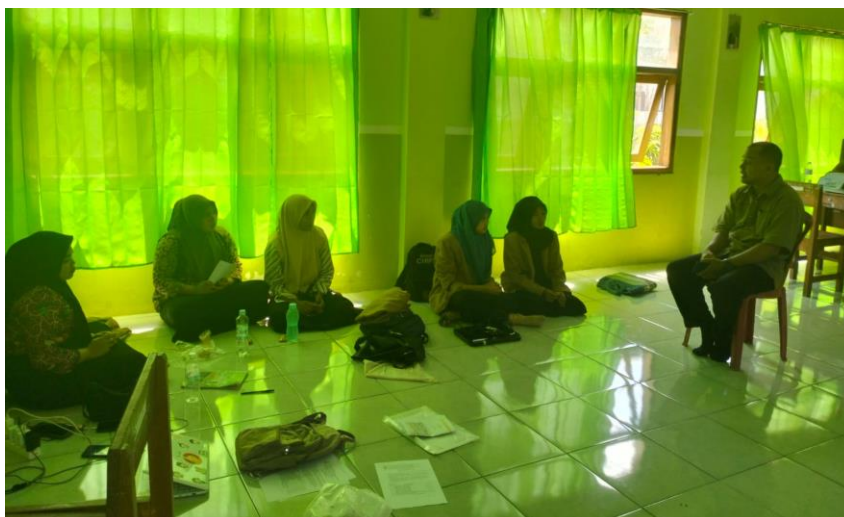
Gambar Kunjungan Dosen Pembimbing Lapangan