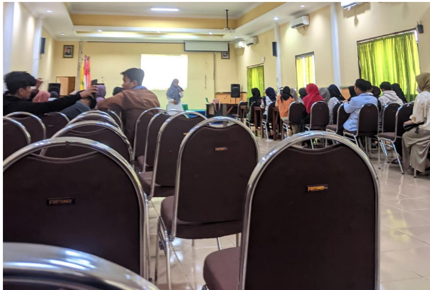
Gambar 2.2 Pembekalan PLP 2

Pembekalan PLP dilaksanakan oleh pihak kampus STKIP PGRI Bangkalan secara luring di Graha STKIP PGRI Bangkalan. Pembekalan tersebut dilaksanakan untuk menyiapkan mahasiswa peserta PLP tentang hal-hal yang berkaitan dengan pelaksanaan PLP mata kuliah yang wajib ditempuh oleh mahasiswa peserta PLP.