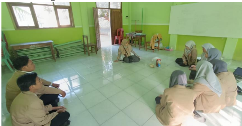
Gambar Kunjungan Koordinator Lapangan