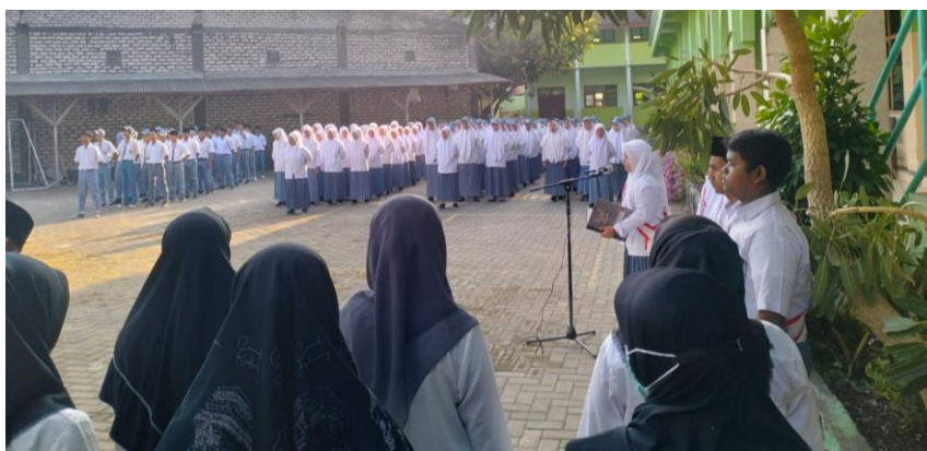
Gambar Upacara bendera