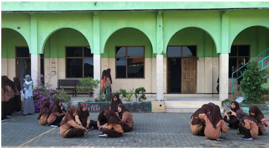
Gambar Kegiatan bersih-bersih