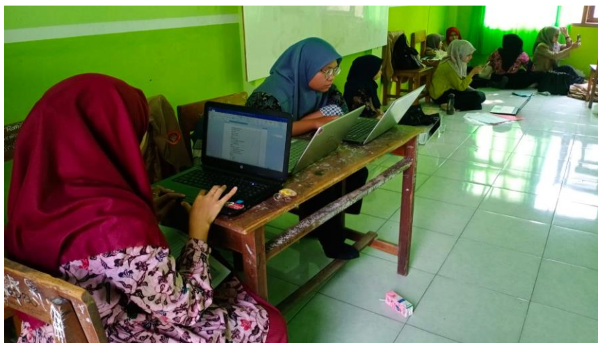
Gambar Kegiatan Membuat Laporan Bersama