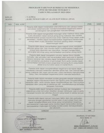
Gambar 2. 3 Prota

Program tahunan merupakan anangan penentuan alokasi waktu selama satu (1) tahun untuk mencapai kompetensi- kompetensi dasar yang ada dalam kurikulum.