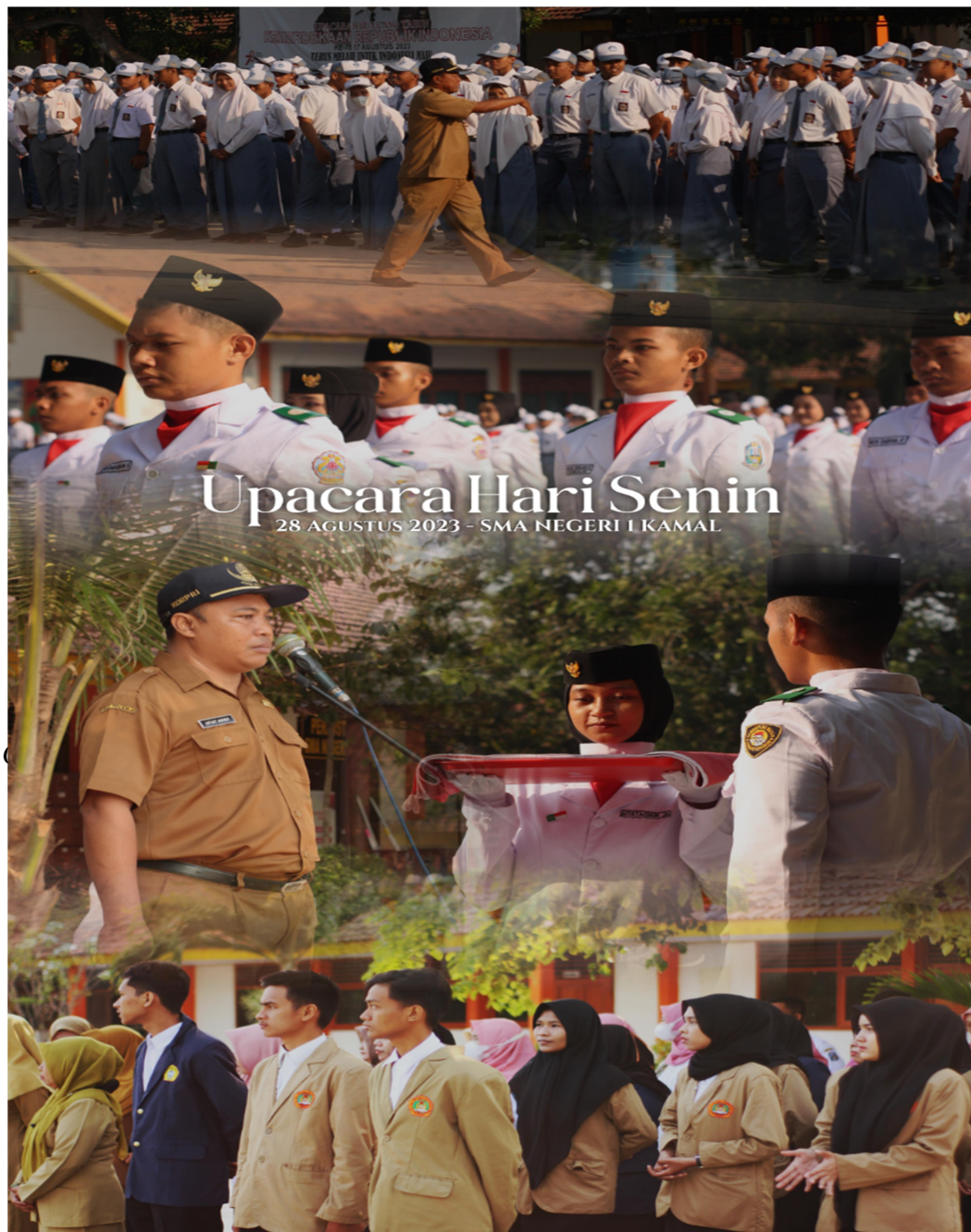
Gambar 3. 1 Dokumentasi Pelaksanaan Upacara Bendera