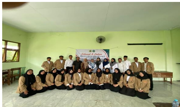
Gambar 2. Foto Bersama guru MA Al-hidayah