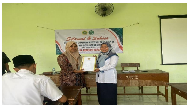
Gambar 3. Penyerahan berkas plp 2