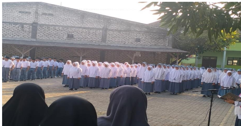
Gambar 7. Kegiatan upacara