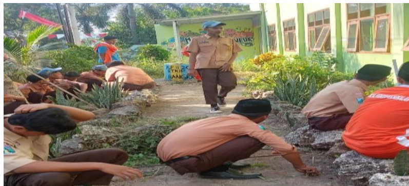
Gambar 6. Kegiatan bersih-bersih