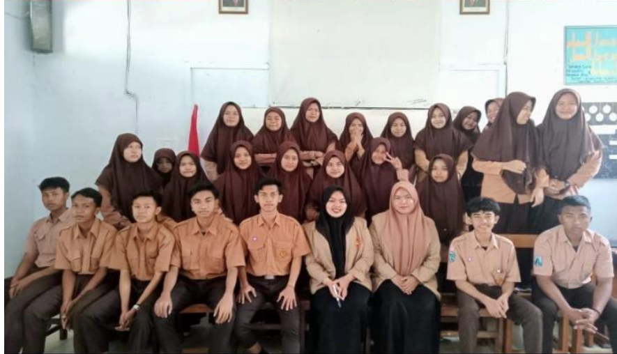
Gambar 4. Kegiatan mengajar kelas X B