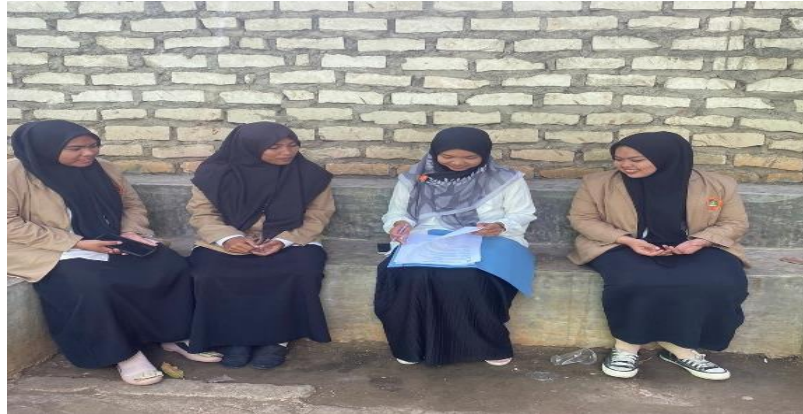
Gambar 5. Kegiatan evaluasi Bersama guru pamong