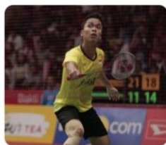
Picture 1.2 Anthony Sinisuka Ginting

Look at the pictures below. Do you know them?