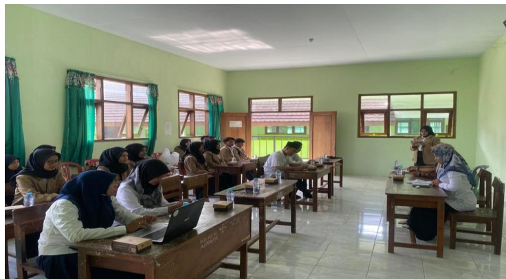
Gambar 1. Pembukaan plp 2