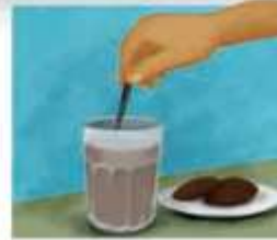
Bab 2 | Di Bawah Atap 37

Mengetahui Guru pamong SD Muhammadiyah 1 Bangkalan