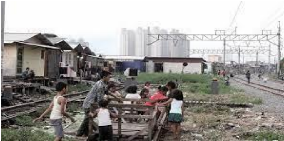
Foto 1: Pemukiman rumah warga didekat rel kereta dan samping Gedung-gedung tinggi