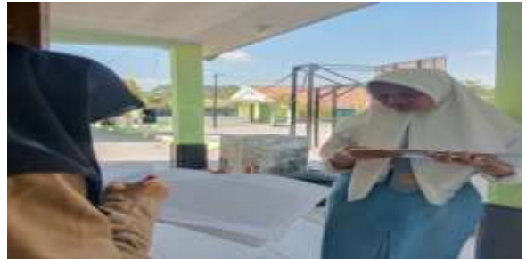
Membantu Petugas BK