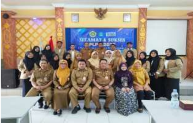
Foto Bersama Kegiatan Pembukaan PLP