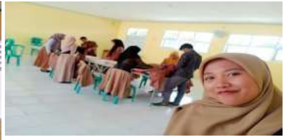
➤ Gambar 7. Kegiatan PESAT (Pesantren Sabtu Ahad)