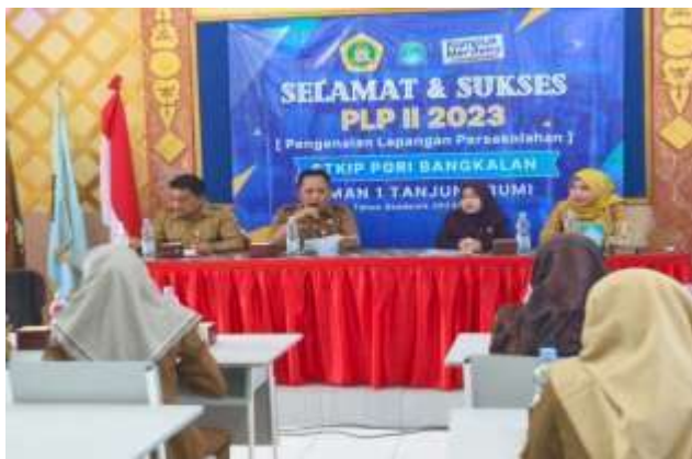
Penerimaan Mahasiswa Peserta PLP II