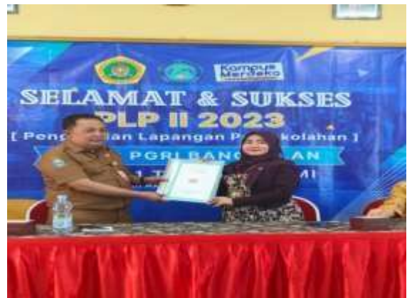
Penyerahan Berkas Administrasi PLP II