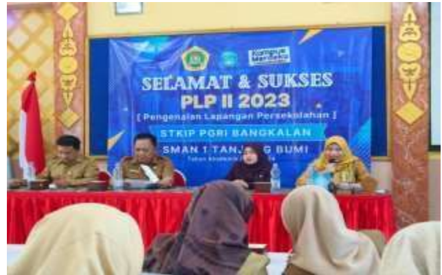
Penyerahan Mahasiswa Peserta PLP II