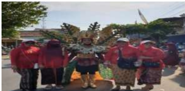
Membantu Pelaksanaan Lomba Karnaval