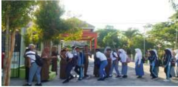
Mengecek Atribut siswa + Penerapan 3S