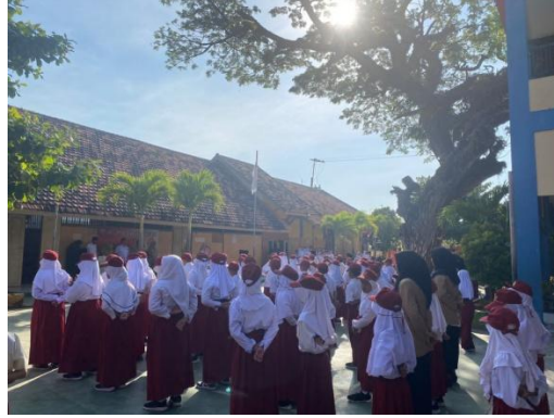
c. Kegiatan pembelajaran