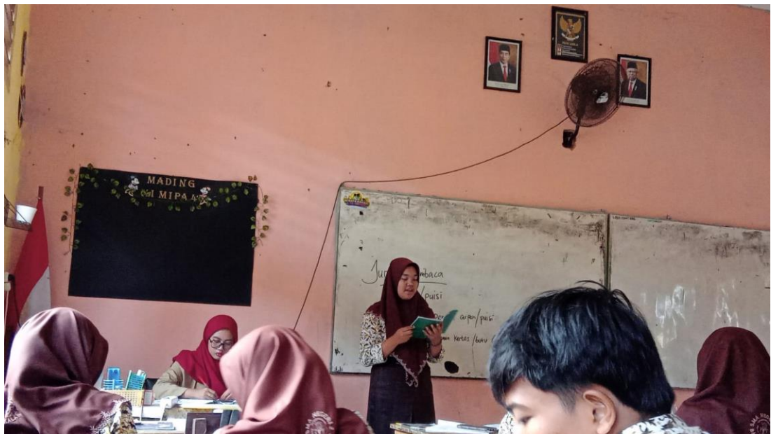
Gambar 2. Kegiatan Pembelajaran