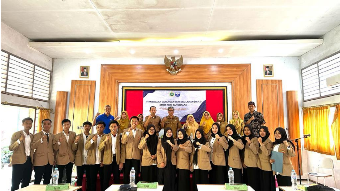
Gambar 1. Pembukaan PLP II