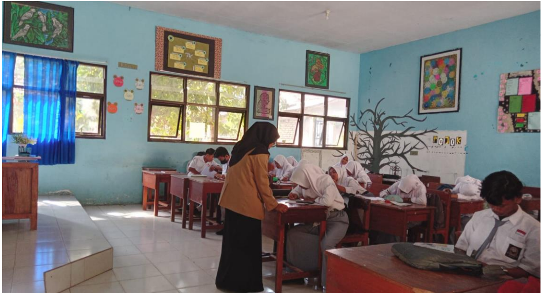
Gambar 3. Kegiatan PBM