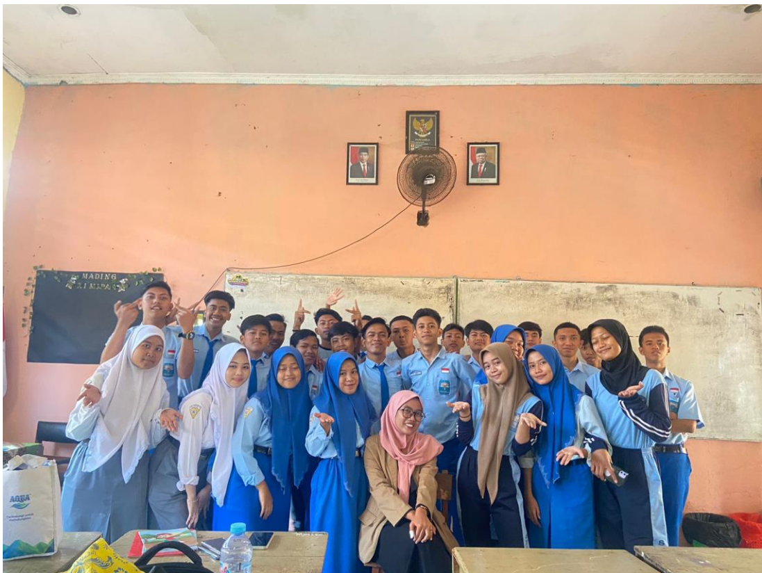
Gambar 4. Foto bersama Murid XI 3