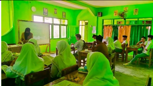
Mengajar di kelas XI IIS