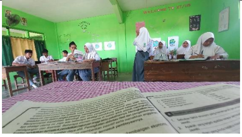
Mengajar di kelas XI IIS