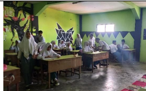
Mengisi kelas kosong di X A