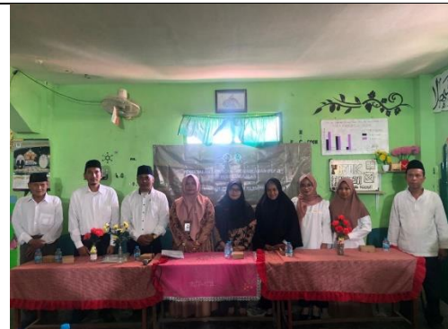
Pembukaan PLP II