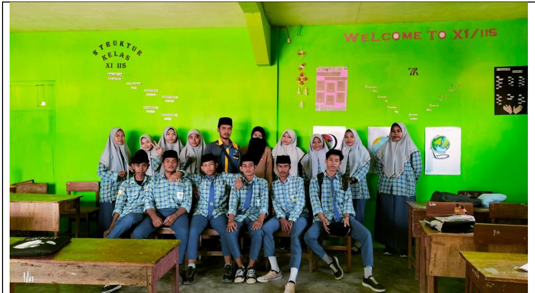
Foto Bersama Guru Pamong dan Siswa Kelas XI IIS