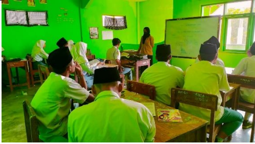
Mengajar di kelas XI IIS