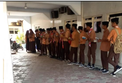
Siswa Membaca yasin karena datang terlambat Sekaligus piket jaga setiap rabu dan sabtu