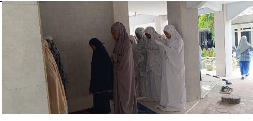
Sholat Dhuhur Berjamaah