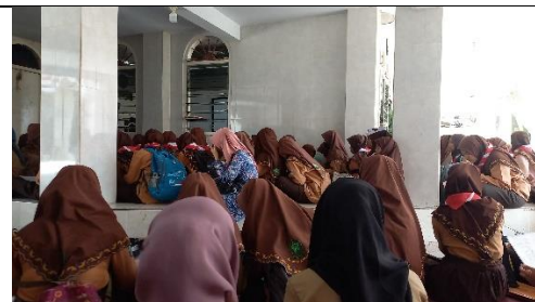
Istigosah bersama setiap hari sabtu