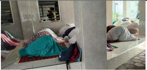
Sholat Dhuha Berjamaah