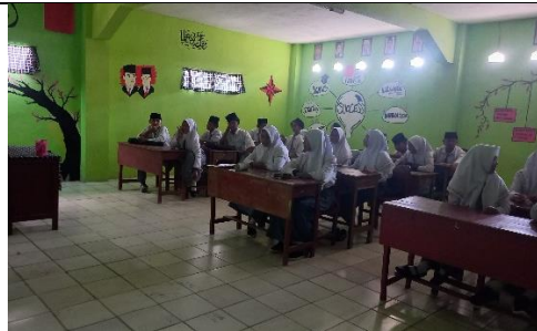
Mengisi kelas kosong di X B