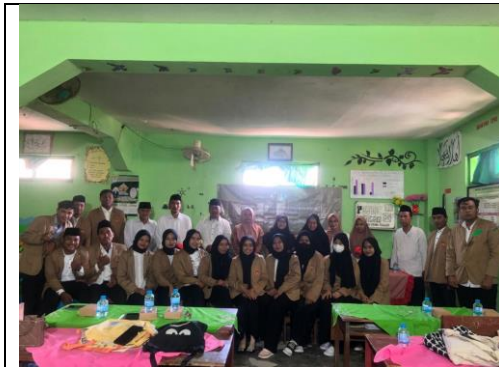
Foto bersama saat pembukaan PLP II