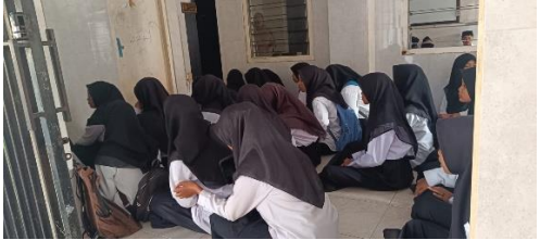
Membaca Yasin Setiap Pagi di Musholla