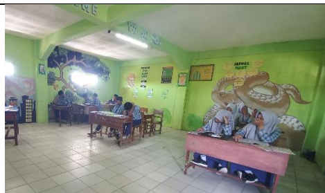
Mengisi pembelajaran Bahasa Indonesia di Kelas XI MIA