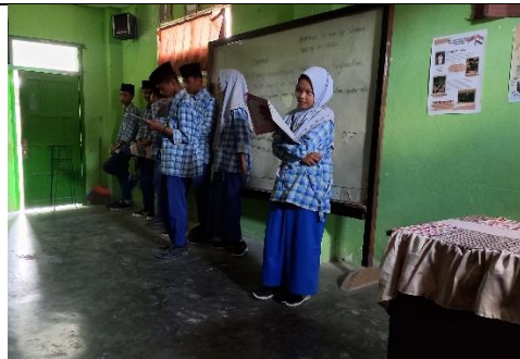
Mengisi Pembelajaran Ekonomi di kelas XII IIS