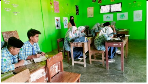
Megajar di kelas XI IIS