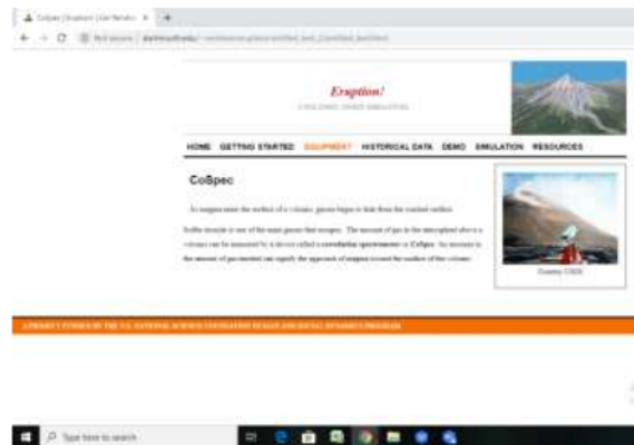
Gambar 2. Tampilan Equipment CoSpec software Eruction

Jenis peralatan tersedia untuk mengumpulkan data untuk membantu memantau aktivitas vulkanik. Berbagai jenis data dikumpulkan dan diinterpretasikan oleh ahli vulkanologi berdasarkan aktivitas masa lalu. Yang terpenting adalah perubahan yang terjadi di gunung berapi yang disebabkan oleh pergerakan magma di bawah permukaan. Sebagian besar aktivitas magmatik sebelum erupsi tidak dapat dirasakan secara langsung. Sebagai gantinya, instrumen dan teknik sensitif digunakan untuk mendeteksi keresahan, dengan berbagai jenis peralatan pemantauan terkait dengan berbagai aspek keresahan vulkanik.