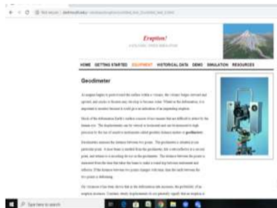
Gambar 4. Tampilan Equipment Geodimeter software Eruption

Saat magma mendekati permukaan dan permukaan berubah bentuk dan gempa bumi dihasilkan. Semakin banyak aktivitas magmatik, semakin banyak gempa bumi terjadi. Dengan melacak jumlah gempa bumi melalui waktu, seseorang bisa mendapatkan gambaran tentang tingkat kerusakan vulkanik. Meskipun gempa bumi besar dapat dirasakan, sebagian besar gempa bumi kecil hanya terdeteksi dengan peralatan sensitif. Seismometer biasanya digunakan untuk mengukur dan mencatat aktivitas seismik di gunung berapi. Pemantauan konstan diperlukan untuk menjaga agar ahli vulkanologi tetap mutakhir. Meskipun ada jenis-jenis gempa bumi yang tidak biasa yang khas gunung berapi yang menandakan jenis kegiatan tertentu, kita tidak akan membedakannya. Jumlah gempa bumi dalam rentang waktu tertentu adalah semua yang akan kita gunakan dalam simulasi. Perubahan dalam jumlah gempa bumi akan menandakan perubahan aktivitas di gunung berapi.