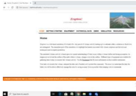
Gambar 1. Tampilan Home software Eruction

Software erupsi tersedia pada laman http://dartmouth.edu/renew/eruption . Software erupsi adalah simulasi aktivitas vulkanik berbasis web yang mengarah pada krisis vulkanik, situasi dimana kehidupan terancam punah. Tujuan simulasi ini adalah untuk mengamati bencana yang terkait dengan letusan gunung berapi dengan alat serta teknik yang digunakan dalam memprediksi erupsi. Aktivitas vulkanik yang disimulasikan didasarkan pada pemahaman tentang apa yang terjadi di dalam gunung berapi sebelum dan selama erupsi. Saat magma bergerak menuju permukaan bumi di dalam gunung berapi, perubahan terjadi di permukaan.