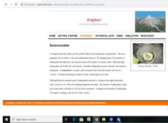
Gambar 3. Tampilan Equipment Seismometer software Eruption

Belerang dioksida adalah salah satu gas utama yang lepas. Jumlah gas di atmosfer di atas gunung berapi dapat diukur dengan perangkat yang disebut spektrometer korelasi atau CoSpec. Peningkatan jumlah gas yang dipancarkan dapat menandakan pendekatan magma terhadap permukaan gunung berapi.