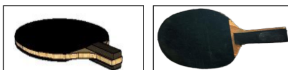
Gambar 4. Desain Gambar Prototype CORE Paddle 215042002

Selanjutnya melalui tahapan uji coba utama di lapangan maupun uji coba berdasarkan pengamatan dilakukan kepada responden dengan teknis yang tentunya tetap fleksibel dengan memperhatikan segala keterbatasan yang dihadapi saat masa pandemi. Prototype bat tenis meja pada seri CORE Paddle 215042002 dikembangkan berdasarkan hasil dari uji coba awal serta masukan dari responden dengan hasil pengembangan desainnya bisa dilihat pada gambar 4.