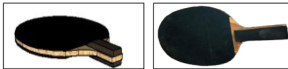
Gambar 4. Desain Gambar Prototype CORE Paddle 215042002

Selanjutnya melalui tahapan uji coba utama di lapangan maupun uji coba berdasarkan pengamatan dilakukan kepada responden dengan teknis yang tentunya tetap fleksibel dengan memperhatikan segala keterbatasan yang dihadapi saat masa pandemi. Prototype bat tenis meja pada seri CORE Paddle 215042002 dikembangkan berdasarkan hasil dari uji coba awal serta masukan dari responden dengan hasil pengembangan desainnya bisa dilihat pada gambar 4.