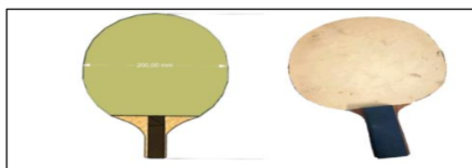
Gambar 2. Desain Gambar dan Foto Prototype CORE Paddle 215042001

Pada tahapan uji coba awal lapangan maupun uji coba berdasarkan pengamatan alat yang dilakukan oleh responden dilakukan dengan teknis yang fleksibel dengan memperhatikan berbagai keterbatasan yang dihadapi. Prototype bat tenis meja dengan seri CORE Paddle 215042001 ini dikembangkan berdasarkan hasil dari tahapan analisis kebutuhan serta beberapa masukan dari ahli di bidang keolahragaan yang hasil pengembangan desainnya dapat dilihat pada gambar 2.