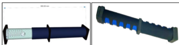
Gambar 3. Desain Gambar Prototype CARE Stick 115042002

Pada uji coba ini akan dilaksanakan serupa teknisnya dengan uji coba di lapangan maupun uji coba berdasarkan pengamatan alat. Prototype tongkat estafet dengan seri CARE Stick 115042002 ini dikembangkan berdasarkan tanggapan dan evaluasi pada uji coba awal terhadap prototype tongkat estafet dengan seri CARE Stick 115042001. Setelah beberapa perbaikan dilakukan maka hasil desain prototype tongkat estafet dengan seri CARE Stick 115042002 dapat dilihat pada gambar 3.