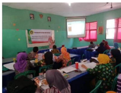
Gambar 2. Pemateri berinteraksi dengan peserta

Pada gambar 1 pemateri sedang memberikan pelatihan penulisan judul, abstrak dan pendahuluan kepada peserta.