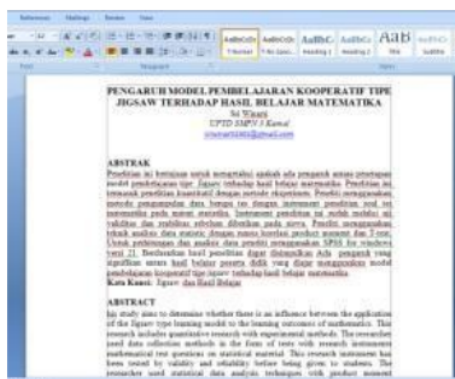
Gambar 5. Contoh hasil penulisan abstrak peserta

Gambar 4 dan 5 menunjukkan bahwa peserta dapat menulis abstrak secara ringkas dan dengan konten yang mewakili isi artikel. Peserta juga dapat menulis abstrak dalam bahasa Inggris. Hal ini menunjukkan bahwa kegiatan pelatihan bermanfaat bagi peserta.