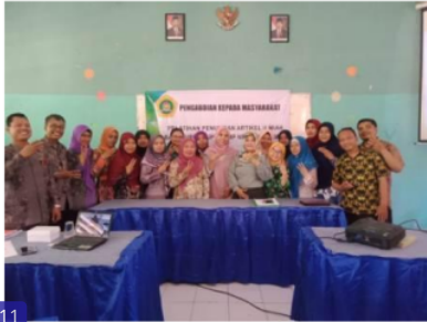
11 Gambar 3. Foto bersama Pemateri dengan Peserta

tentang cara penulisan konten pendahuluan dan metode yang digunakan dalam penelitian