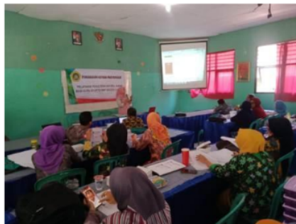
Gambar 1. Pemateri Menjelaskan Sistematika Artikel

abstrak, menulis konten pendahuluan, mempelajari metode penelitian, mendeskripsikan hasil penelitian dan pembahasan dalam artikel, menyimpulkan hasil penelitian dan penulisan daftar rujukan atau daftar pustaka.