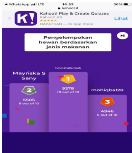
Gambar 3 : Hasil Challenge Peserta Didik Menggunakan Aplikasi Kahoot Pada Pokok Bahasan Pengelompokan Hewan Berdasarkan Jenis Makanan

Tahapan terakhir dari program pengabdian kepada masyarakat ini adalah pemberian angket respon kepada para pendidik selaku pembuat produk evaluasi pembelajaran dan para peserta didik selaku pengguna dari hasil produk evaluasi pembelajaran. Pertanyaan antara angket untuk pendidik dan peserta didik dibuat berbeda karena keduanya memiliki fungsi yang berbeda. Berikut ini adalah hasil penilaian angket respon pendidik dan peserta didik.