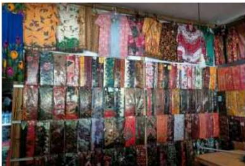
Gambar 3. UMKM Pengrajin Batik Tulis Madura

Berdasarkan pada Gambar 1, 2, dan 3 dapat terlihat dengan jelas bahwa klasifikasi responden merupakan pelaku UMKM yang berjualan sepanjang jalan di Area Jembatan Suramadu. Dalam pengambilan data penelitian yang dilakukan dengan wawancara telah dilakukan kepada tiga pelaku UMKM khususnya area Jembatan Suramadu Bangkalan. Pengambilan data penelitian dimulai dari 18 Mei 2021 sampai 01 Juni 2021.