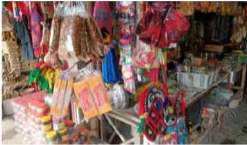
Gambar 2. UMKM Pernak-pernik Khas Madura