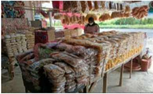
Gambar 1. UMKM Camilan Khas Madura