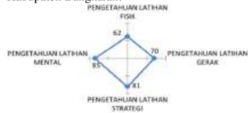
Gambar 1. Diagram Radar Pemetaan Kompetensi Pelatih dan Pembina Ekstrakurikuler Bola Basket di Kabupaten Bangkalan

peta kompetensi pengetahuan Pembina dan Pelatih Ekstrakurikuler bola basket Di Tingkat Sekolah Menengah se-Kabupaten Bangkalan?. Maka melalui diagram radar berikut ini dapat tergambarkan pemetaan pengetahuan pelatih dan pembina ekstrakurikuler bola basket se-Kabupaten Bangkalan.