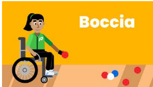
Gambar 1. Ilustrasi Permainan Boccia