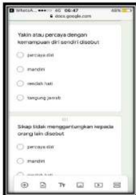
Gambar 5. Tampilan soal pada googleform