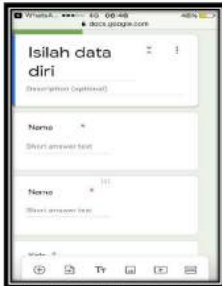
Gambar 4. Tampilan identitas sebelum