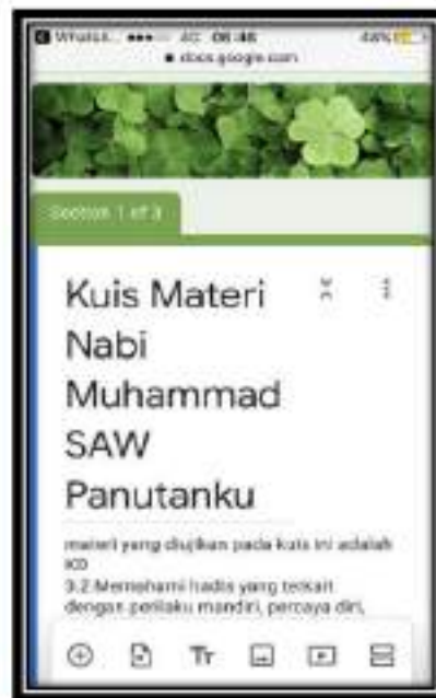
Gambar 3. Tampilan awal googleform

Setelah tahap pertama selesai kami lakukan, kemudian kami memasuki tahap kedua yaitu tahap pendampingan kepada setiap guru-guru yang telah mengikuti proses pelatihan. Proses pendampingan dilakukan selama 2 minggu. Tim kami membagi 20 peserta pelatihan ke dalam 3 kelompok pendampingan. Setiap kelompok akan mendapatkan 1 orang pendamping dari tim kami. Proses pendampingan bertujuan untuk memfasilitasi peserta pelatihan yang masih bingung dalam membuat googleform yang kami tugaskan pada akhir tahap pertama kegiatan pengabdian kepada masyarakat. Berikut ini adalah salah satu contoh tampilan googleform yang sudah berhasil dibuat oleh salah satu peserta yang merupakan guru bidang studi agama islam.