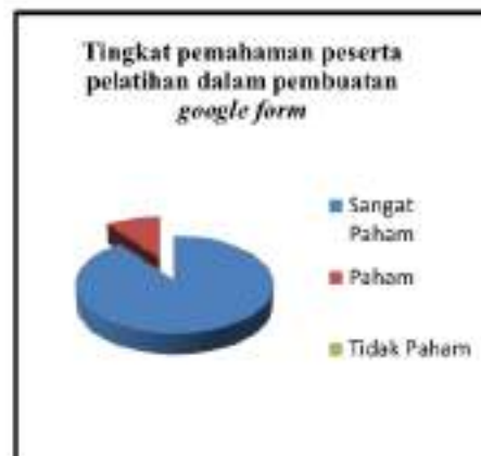
Gambar 7. Diagram tingkat pemahaman peserta pelatihan dalam membuat googleform

Setelah proses pendampingan dilakukan oleh tim kami dan setiap peserta pelatihan sudah menghasilkan minimal sebuah media evaluasi berbentuk googleform dengan baik dan bisa diakses oleh siswa selanjutnya kami masuk ke tahap terakhir dari program pengabdian kepada masyarakat yaitu tahap pengisian angket responden yang harus diisi oleh seluruh peserta pelatihan. Peserta mengisi angket responden melalui googleform yang kami buat. Berikut ini adalah hasil persentase dari angket responden yang sudah diisi oleh peserta.