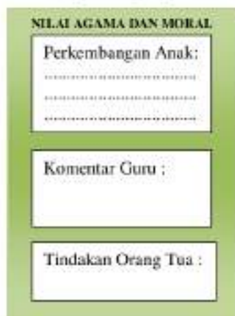
Gambar 4. Tampilan Isi Aplikasi PALAPA