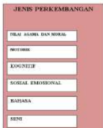
Gambar 3. Tampilan Ketiga Aplikasi PALAPA