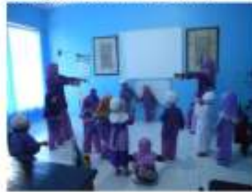
Gambar 1. Suasana belajar TK An-Shal

Berikut ini adalah potret dari proses pembelajaran di TK AN-SHAL.